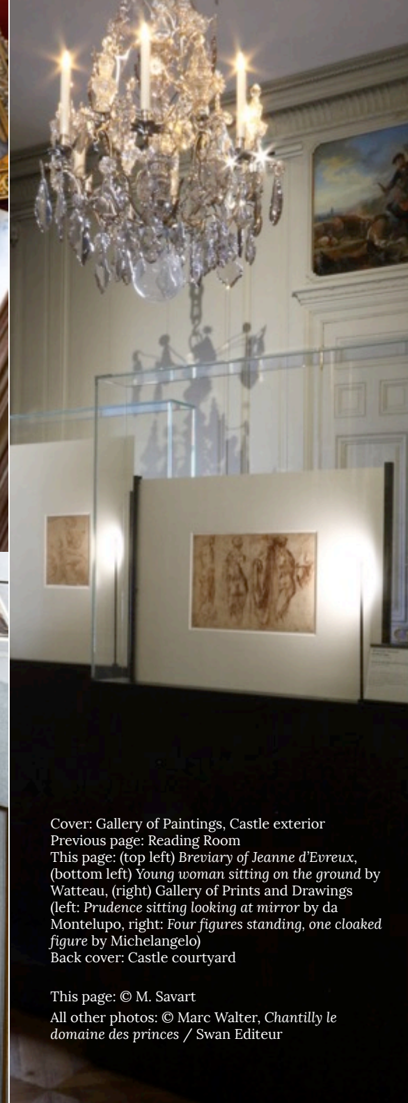
Cover: Gallery of Paintings, Castle exterior Previous page: Reading Room This page: (top left) Breviary of Jeanne d'Evreux , (bottom left) Young woman sitting on the ground by Watteau, (right) Gallery of Prints and Drawings (left: Prudence sitting looking at mirror by da Montelupo, right: Four figures standing, one cloaked figure by Michelangelo) Back cover: Castle courtyard

This page: © M. Savart All other photos: © Marc Walter, Chantilly le domaine des princes / Swan Editeur