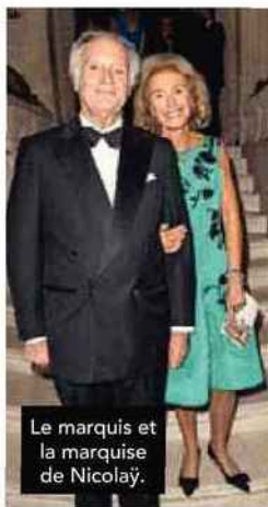
Le marquis et la marquise de Nicolăy.