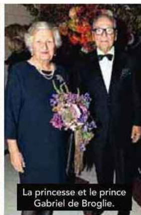
La princesse et le prince Gabriel de Broglie.